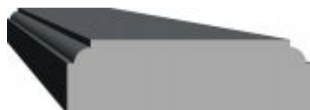
[14] więcej » [14] Szer: 22 cm Wys: 8 cm