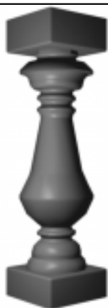
[7] więcej » [7] Szer: 15 cm Wys: 60 cm

Opublikowane na Kolumny Tralki betonowe Bonie Sztukateria elewacyjna Gzymsy styropianowe ( https://gzymsy-elewacyjne.eu )