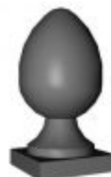
[15] więcej » [15]