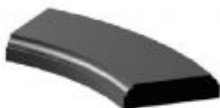
[10] więcej » [10] Szer: 22 cm Wys: 8 cm