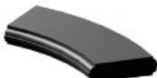
[11] więcej » [11] R: dowolny Szer: 22 cm Wys: 8 cm Śr: dowolna