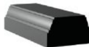
[9] więcej » [9] Szer: 26 cm Wys: 15 cm