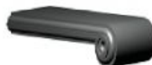
[12] więcej » [12] Szer: 22 cm Wys: 8 cm