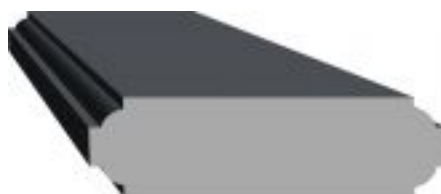
[13] więcej » [13] Szer: 22 cm Wys: 8 cm