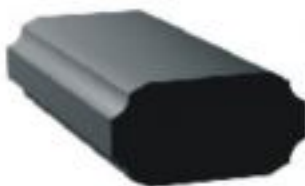
[8] więcej » [8]